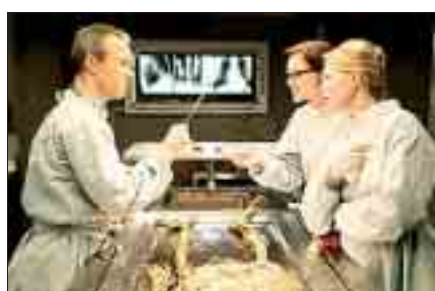
„Erzählt mir was“: Dazu fordert Dr. Koch (Hannes Jaenicke, l.) seine Leichen auf.

Mit 1300 bis 1500 Schnitten pro 45-Minuten-Folge hat „Post Mortem“