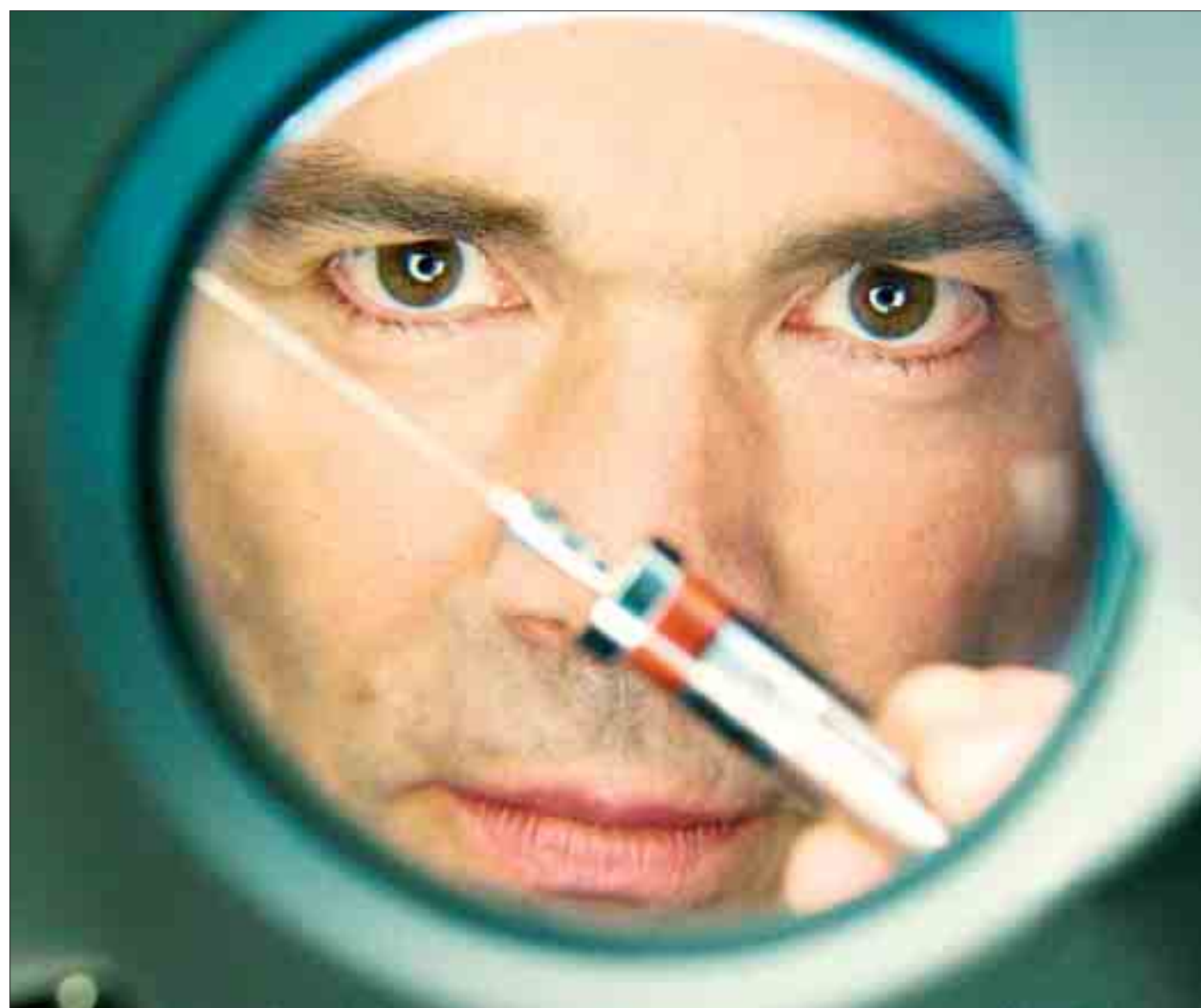
Mit dem Mikroskop auf Mörderjagd: Hannes Jaenicke ist Dr. Daniel Koch, Rechtsmediziner in „Post Mortem“.