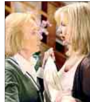
Schwiegermama: Marion Kracht (r.) mit Rosemarie Fendel.

MÜNCHEN Die ARD setzt heute ihre Reihe „Familie Sonnenfeld“ fort. Marion Kracht und Helmut Zierl sind wieder als Ehepaar zu sehen, die mit ihren Kindern und der Oma (Rosemarie Fendel) unter einem Dach leben. „Glück im Unglück“ heißt der heutige 90-Minüter, in dem unter anderem Vater Carlos' Firma in finanzielle Schwierigkeiten gerät. Die vergangenen Filme rund um die Familie sahen rund sechs Millionen Zuschauer.