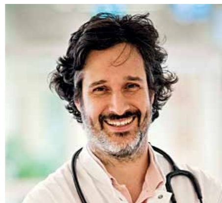
The Dox (3)

ge, und auch Weydt ist Neurologe. Sein Doktorvater nehme es mit Humor, sagt Hagemeyer, und necke ihn damit, dass in jeder „Bergdoktor“-Folge mindestens viermal der Hubschrauber fliege. Andere seien sogar ein wenig neidisch. Die großen Fernsehformate legen mittlerweile Wert auf Realismus. Was sich auch daran zeigt, dass es längst weitere Fachberatungsfirmen gibt, etwa „Flatliners“ und „Medical Movie Service“ in Berlin. Doch noch immer läuft aus Medizinersicht nicht alles optimal im Vorabend- und Abendprogramm: Noch immer spazieren Fernsehchirurgen ohne Mundschutz in einen Operationssaal.