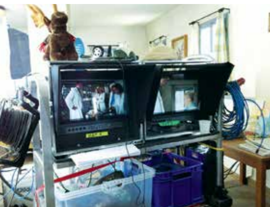
Die Agentur „The Dox“ bietet medizinische Beratung für Film- und Fernsehmacher an. Sie sorgen für den korrekten medizinischen Kontext in den Drehbüchern.