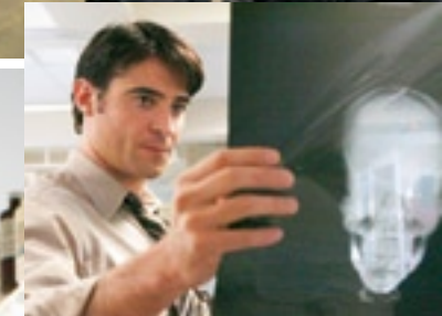
Überarbeitet, arrogant und unglücklich verliebt: Ärzte in den modernen Serien