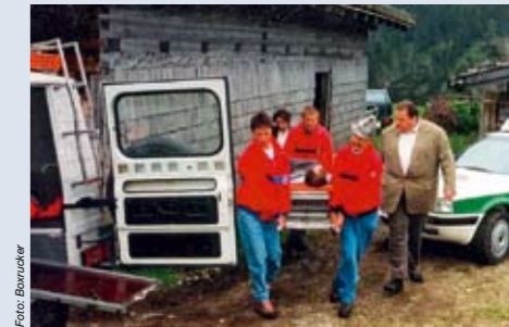
Auch in der Sat1-Serie „Der Bulle von Tölz“ kommt der Rettungsdienst immer wieder zum Zuge.