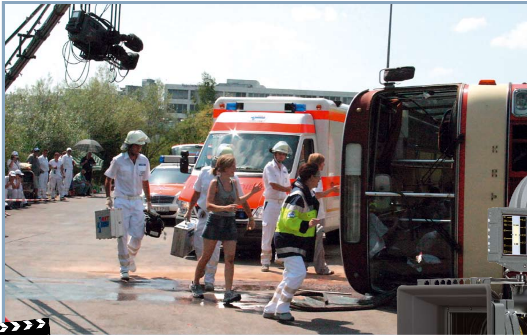
Einsätze im Rahmen von Filmproduktionen sind etwas Besonderes. Das Szenenbild wird oft mit Kulissen nachgebaut, weil sich geeignete Locations nur schwer finden lassen.