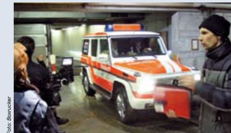
Auf Wunsch des Regisseurs wird auch schon mal zum Einsatzort gehetzt oder gleich nach dem Einladen des Patienten ohne Versorgung losgefahren. Das entspricht selten der Realität, ist aus Gründen der Dramaturgie aber manchmal notwendig.

gleich nach dem Einladen des Patienten ohne Versorgung losgefahren. „Das entspricht natürlich nicht der Realität, diese wäre aber im Film zu langatmig und für den Zuschauer zu langweilig“, vermutet Maier.